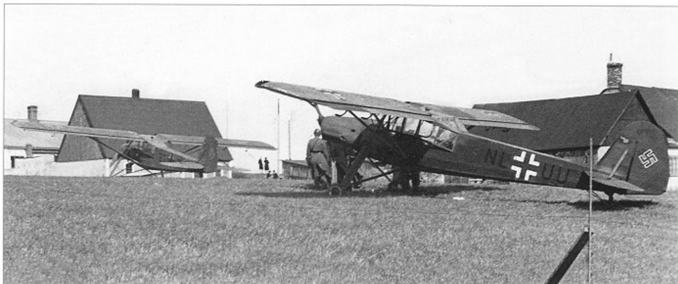
Flygplanet till höger med koden NL+UU övergick senare till flygöapnet som S 14B med nummer 3821.

och hade den senaste tiden arbetat som kocka vid den tyska flygbasen. Uppenbarligen fick hon nu en möjlighet att klara sig undan repressalier från framryckande sovjetiska förband. Efter landningen fördes hon till epidemisjukhuset i Ystad för läkarkontroll.