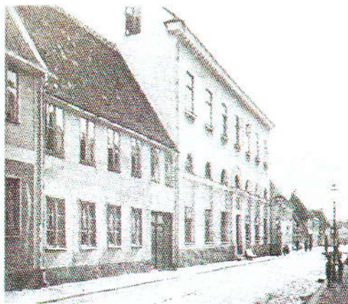
Den gamla husar/dragonkasernen.