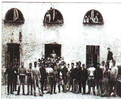
Främlingar från dragornens gamla kasern vid Stora Östergatan i kvarteret Carl. Fotat taget 1902