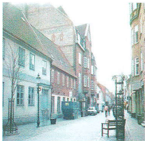
Det höga huset är byggt på den gamla kasernens tomt. Det låga huset närmast har fått sin fina korsvirkesfasad åter vid någon senare reovering.