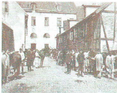
Bilder från innergården.