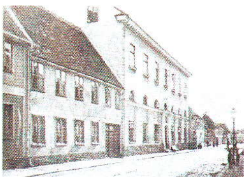
Husarkasernen vid St Östergatan 34.