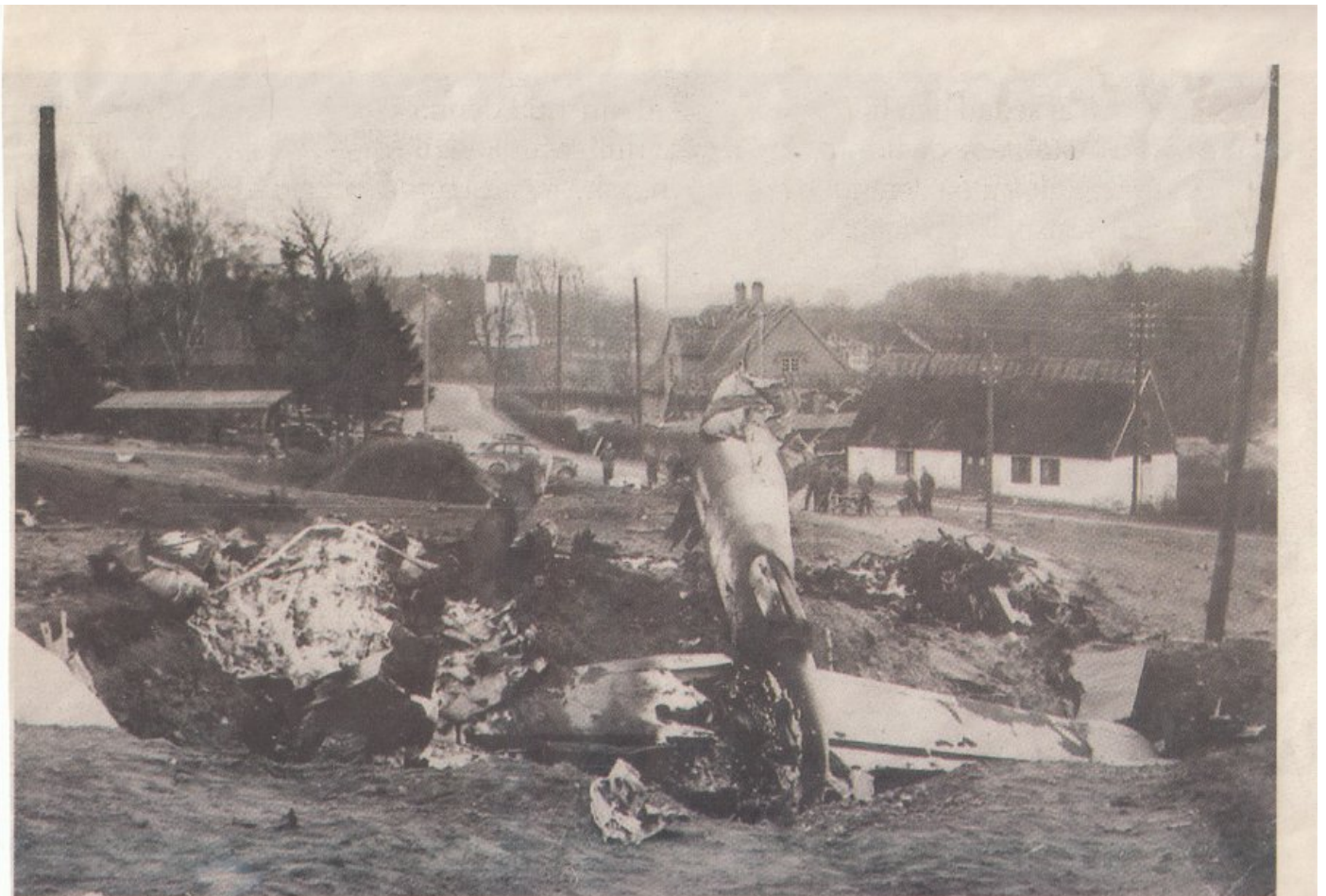
Messerschmitten blev nästan totalförstörd vid kraschen. Metalldelar och ammunition spreds över ett stort område och explosionsrisken var överhängande tills långt in på kvällen. I dag heter vägen där planet störtade Klockarevägen och den har fått en annan sträckning.