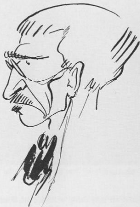
1. Bilden hämtad ur Lundagård 1924.